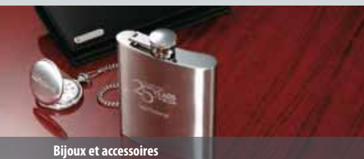
Bijoux et accessoires