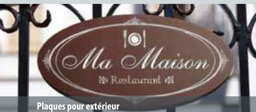
Plaques pour extérieur