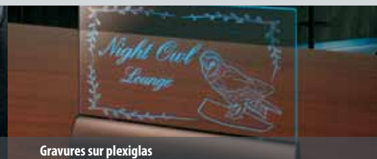
Gravures sur plexiglas