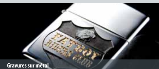
Gravures sur métal