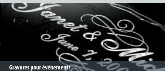
Gravures pour événements