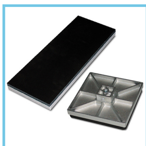
Option adaptable : petits plateaux et élément à casquettes.

Données techniques pouvant être soumises à des modifications sans préavis.